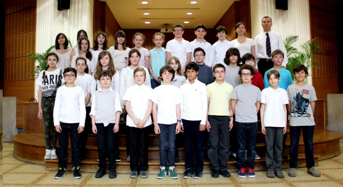
CLASSE DE SIXIÈME 3 - BI-LANGUE RUSSE-ANGLAIS